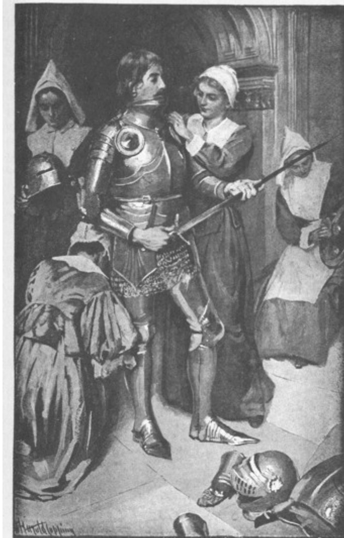
CRISTIANO VESTIDO DE ARMADURA

PRUD. — Así es; peligroso es, sin duda, para un hombre ascender al valle de Humillación, que es adonde vas ahora, y no tener algún tropiezo; por eso hemos salido para acompañarte.